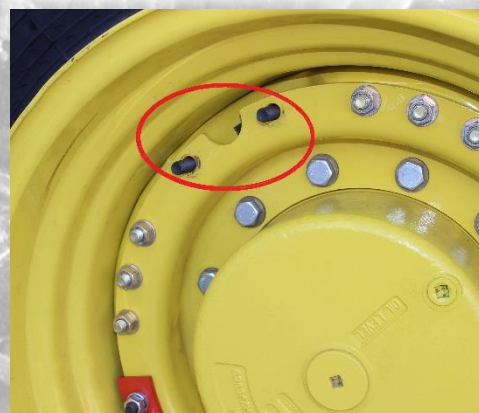
Рис. 2 Болт М16х90 с гайкой и гровером.