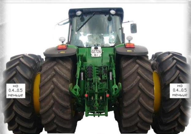
Рис. 8 Давление в шинах