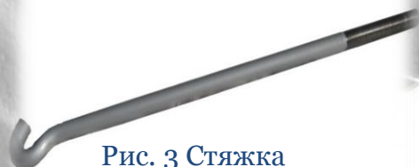
Рис. 3 Стяжка