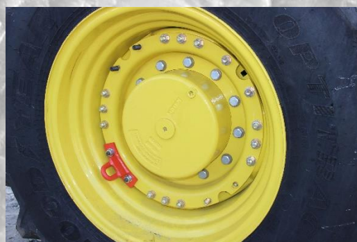
Рис. 5 Установка скоб

1.2 Для установки скобы (рис.1) нужно заменить штатные болты крепящие фланец колеса к ободу на удлиненные, поставляемые в комплекте, как показано на (рис.5). Затяжку производить с усилием 450...500 Н*м.