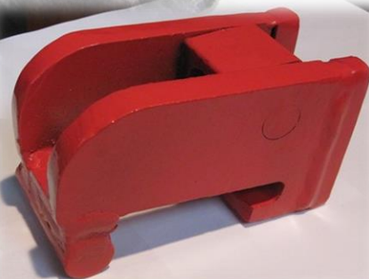
Рис. 4 Замок