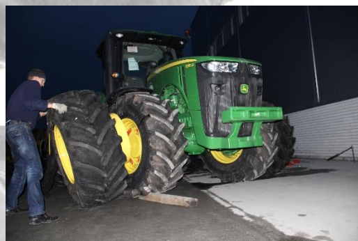
Рис. 6 Подкладка доски под колеса

2.2 Подкатываем наружное колесо к трактору, соблюдая правильность направления протектора, и соединяем его проставочной трубой с внутренним колесом. На трубе допускается небольшая овальность, которая убирается после стягивания дополнительного колеса с основным.