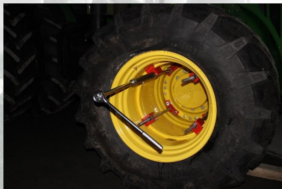
Рис. 7 Расположение замков и стяжек

3.2 Остальные стяжки крепятся таким же способом. Перед затяжкой стяжек нужно проверить правильность расположения стяжек. На (рис.7) показано правильное расположение стяжек. Перед затяжкой резьбу на стяжке смазываем машинным маслом. Затяжку производим равномерно по всей окружности колеса, избегая перекоса наружного колеса относительно внутреннего с усилием 300 Н*м.