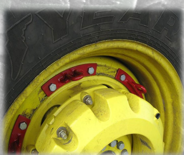
Рис. 5 Встановлення скоб

1.2 Для встановлення скоби (рис.1) потрібно відвернути болти, що кріплять колесо до трактора і встановити їх, як показано на (рис.5). Штатну шайбу треба забрати. Затяжку робити із зусиллям 450...500 Н*м.