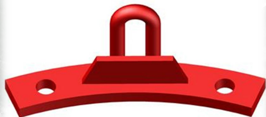
Рис. 1 Скоба

Встановіть трактор на рівній площадці так, щоб до нього був вільний доступ з усіх боків. Переконайтеся, що трактор стійкий до перекидання. Перевірте комплектність усіх комплектуючих. У комплект складальних одиниць входять: скоба-12 шт. рис.1, стяжка-12 шт. рис.2, замок – 12 шт. Мал. 3 гайка М24-12 шт., шайба фігурна D24-12 шт.