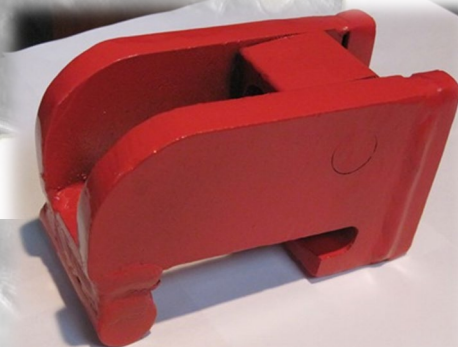
Рис. 3 Замок