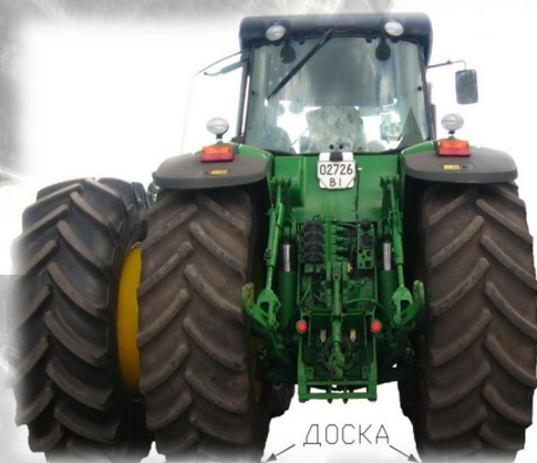
Рис. 6 Підкладка дошки під колеса

2.2 Підкачуємо зовнішнє колесо до трактора, дотримуючись правильності напрямку протектора, і з'єднуємо його трубою проставки з внутрішнім колесом. На трубі допускається невелика овальність, яка забирається після стягування додаткового колеса з основним.