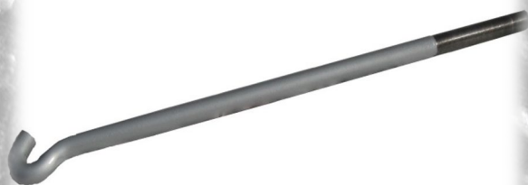
Рис. 2 Стяжка