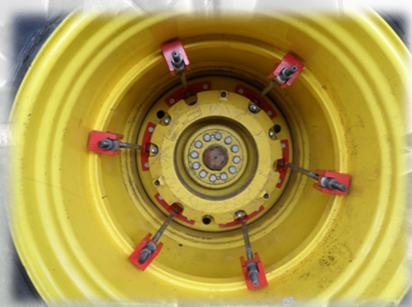
Рис. 7 Розташування замків та стяжок

3.2 Інші стяжки кріпляться таким же способом. Перед затягуванням стяжок потрібно перевірити правильність розташування стяжок. На (рис.7) показано правильне розташування стяжок. Перед затягуванням різьбу на стяжці змащуємо машинним маслом. Затяжку робимо рівномірно по всьому колу колеса, уникаючи перекосу зовнішнього колеса щодо внутрішнього із зусиллям 300 Н*м.